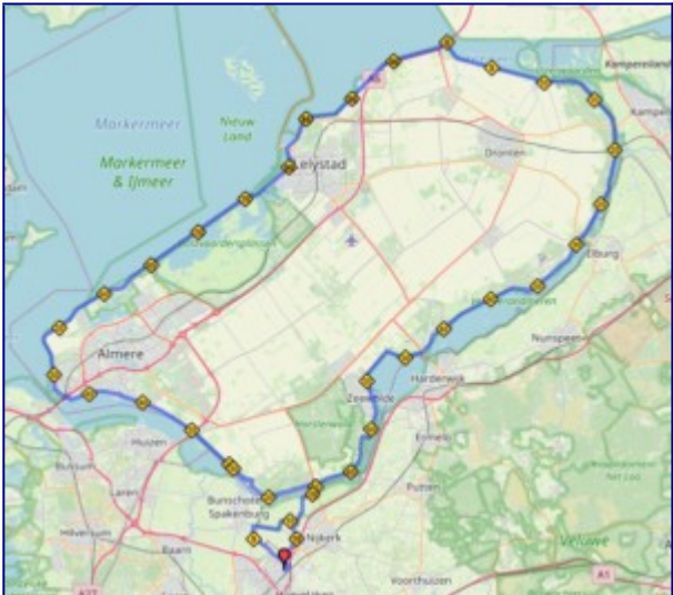
Daarna marathon ronde om Amersfoort: route